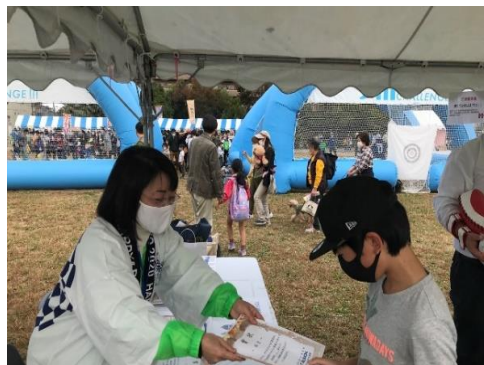
▲ (5) TEAM NAMISUKE の活動