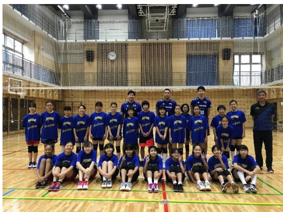
▲バレーボール等体験会