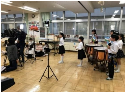
▲ (3) 国歌合唱と応援メッセージの撮影