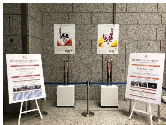
▲聖火トーチ巡回展示（イメージ）