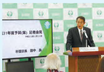
▲昨年度記者会見の様子