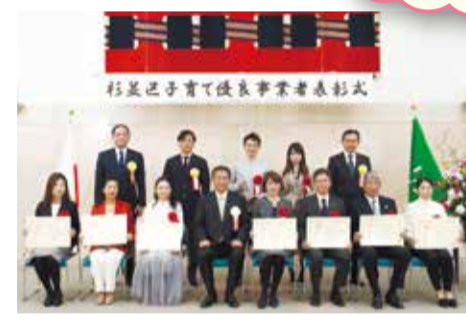
▲表彰式(12月9日(月)開催)の様子。