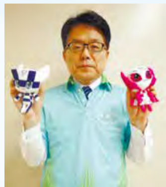
▲オリジナルユニフォーム着用。

区では、永福体育館に整備したビーチコートで、イタリアビーチバレーボールチームの事前キャンプが決定しています。また、ボランティア活動を気軽に行える登録制度を設け、現在600名を超える方が語学、ホームステイ・ホームビジット、イベントなどの活動を後押ししています。これまでに、100名以上の方が、区内のイベントに参加して東京2020大会の盛り上げに貢献しているのは、とても素晴らしいことです。ボランティア参加者はスタンプを集めると「TEAM NAMISUKE」のロゴの入ったオリジナルユニフォームに交換できますので、小中学生の皆さんにも、ぜひ参加して欲しいですね。