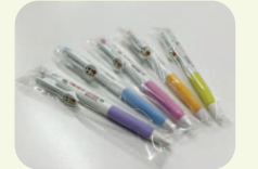
ボールペン・シャープペンシル

オープンハウスにお越しいただいた方に、なみすけグッズをさしあげます。(数に限りがあります)