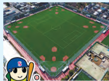
昔は、プロ野球にも使われる上井草球場があったんだね

すぎなみ学倶楽部では、杉並のスポーツ施設の歴史や特徴などを紹介しています。永福体育館がイタリアビーチバレーボールチームの東京2020オリンピック事前キャンプ地として利用されるのも、うれしいニュース。皆さんも身近な施設を上手に活用して、来年は「スポーツを楽しむ一年」にしましょう。(夏)