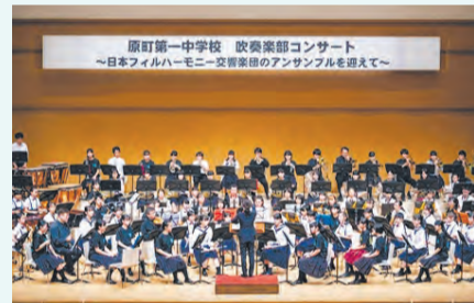
▲南相馬市立原町第一中学校吹奏楽部との合同演奏の様子(南相馬市)

時12月16日(月)～27日(金)午前9時～午後5時(22日(日)を除く。27日は4時まで) 場区役所2階区民ギャラリー 文化・交流課