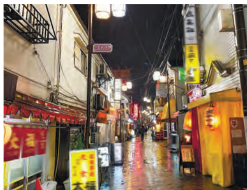
▲スターロード商店街

半年ほど前に新居を構えて引っ越しましたが、新しい家は荻窪。相変わらず杉並ですね。生まれてこの方40年間、一度も杉並を離れて暮らしたことがないです。実家は阿佐ヶ谷なので、今日のこの辺り（スターロード商店街など）はなじみの場所。すぐそこにある居酒屋は僕の同級生が親から継いでいて、子ども同士も同い年なので今もよく飲みに行きます。