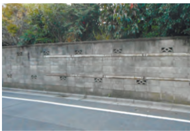
▲改修前 助成対象となったブロック塀