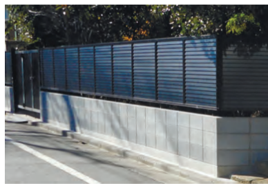
▲改修後 既存ブロック塀を全て撤去し、軽量フェンスに改修