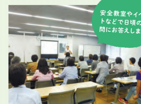
安全教室やイベントなどで日頃の疑問にお答えします

● 出前型自転車安全教室 自転車の交通ルールやマナーについて、皆さんの所にお伺いして、講習を行います。 ☎ 杉並土木事務所 ☎3315-4178