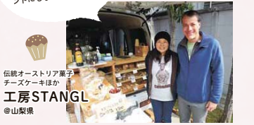
伝統オーストリア菓子 テースケースほか 工房STANG @山梨県

出店しながら他のお店を見るのも楽しみ。ここで見つけたスイーツで新しい味に挑戦したり、アイデアのヒントにもなっています。