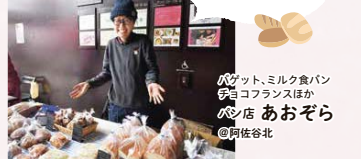
バゲット、ミルクパン 伊豆コフランほか パン店 あおぞら @阿佐谷北

楽しく飲んで食べてしゃべって。お客さんもお店の人も一緒に楽しむ雰囲気がとてもいいですね。また出店したいです。