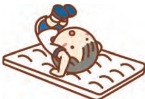
…… いずれも ……

5月4日(祝)午後1時15分～2時=小学1年生▶2時10分～2時55分=3・4歳▶3時5分～3時50分=年中長▶4時～4時45分=小学2・3年生 ⑨各8名(申込順)