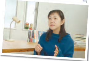
▲小説家・角田光代

区では、杉並にゆかりのある文化人・芸術家の活動の軌跡を、区の貴重な文化財産として記録・保存し、後世に伝えるための映像作品「杉並ゆかりの文化人アーカイブ映像集」を制作しています。