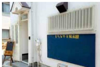
シニアシェアタウンセンター

高齢者向けの空家利活用の先事例や空家対策と住宅支援を両立するためのポイントなどについての講演。