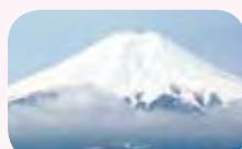
▲富士学園付近から見た富士山

…………… いずれも …………… 問 園あんしん宿予約センター ☎0120-844-891(午前9時～午後5時)