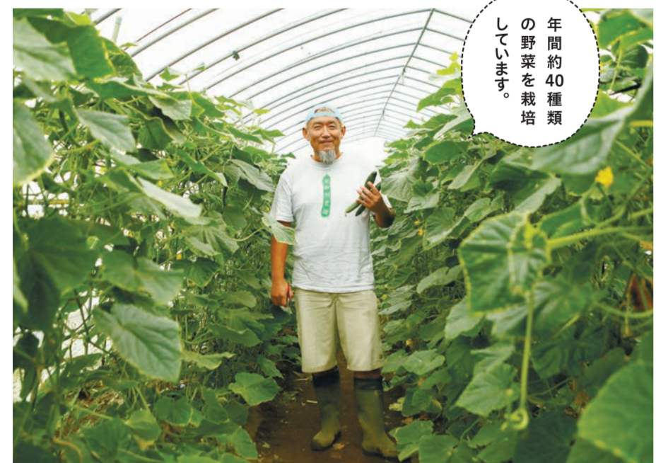
年間約40種類の野菜を栽培しています。

農業のいいところは健康的なことかな。年齢もありますが、体力面ではラグーマンだった時よりもキツイです(笑)。それでも、朝早く起きて、汗を流して土をいじって野菜の手入れをして、日が沈んだら仕事を終えるというサイクルは、心身ともにすごく健康だと実感しています。一方で大変なのは、やはり自然相手の仕事だということ。野菜は日々観察して手入れしていればある程度先の予測ができるのですが、天候に関しては本当に難しい。とくに近年は想像を超える気象現象が多いので、なおのことです。