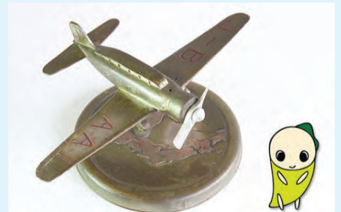
貴重な資料のご提供 ありがとうございます

すぎなみ学倶楽部では、こうした資料の一部をデジタル画像にし、「歴史資料集」コーナーで公開しています。「神風」号の置物や狄嶺のパスポートなどを、いろいろな角度から撮影して掲載しています。博物館で見ているように眺めることができますのでご覧ください。(北)