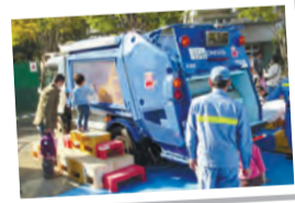
図 エコクイズ、工場見学会、小学生環境作品展示、ごみぱっくん号収集体験、燃料電池自動車・働く車の展示、アンネのバラのボランティア紹介など

図 食品の条件=①未開封で包装・外装が破損していない(米を除く) ②瓶詰・冷凍・冷蔵でない ③賞味期限まで2カ月以上あり、明記されている(米、塩等を除く) ④商品説明が外国語のみでない ▶ 食品例 =国産米(精米から2年以内)、インスタント・レトルト食品、缶詰、乾物・乾麺、粉物、調味料、菓子、飲料(アルコール類を除く)、乳児用食品(粉ミルクほか) 図 区ごみ減量対策課事業計画係 他 受け取り時に、種類や条件などを確認。食品の状態によってはお持ち帰りいただく場合があります