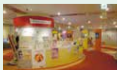
▲ 杉並アニメーションミュージアム受付