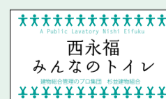
▲ 建物に掲示するデザイン(イメージ)