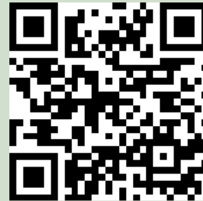
受講報告兼アンケート 二次元コード