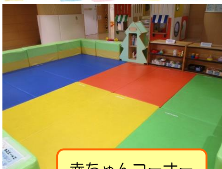
赤ちゃんコーナー