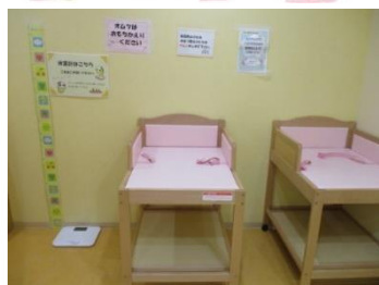
おむつ替えコーナー