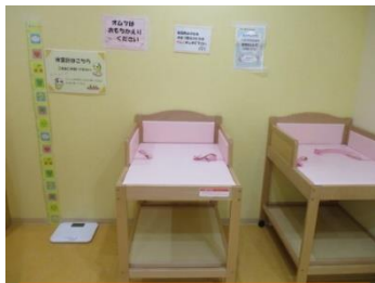
おむつ替えコーナー