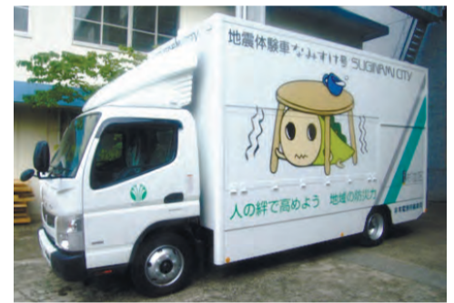
起震車「なみすけ号」▶