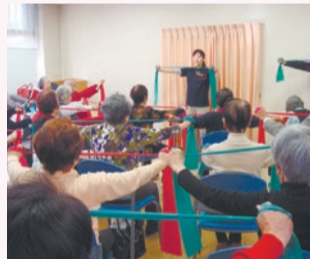
◀医療・介護の専門職による体操教室で、高齢者の健康増進を目指します(上荻元気プロジェクト)