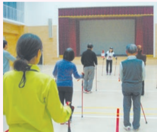
◀ポールウォーキングで、高齢者の健康増進を目指します(NPO法人杉並さわやかウォーキング)