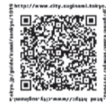
選挙管理委員会事務局