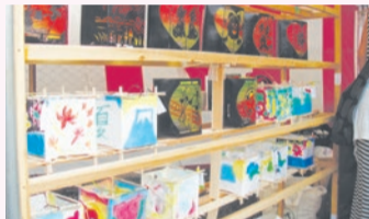
▲「灯り」がテーマのイベントで、世代間交流と文化継承を図ります(井草ふるさとネット)