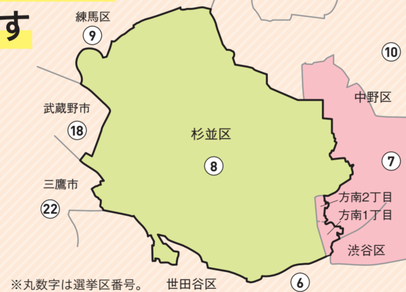
※丸数字は選挙区番号。世田谷区

衆議院議員小選挙区の区割り変更に伴い、杉並区は、東京都第7区と東京都第8区に分かれます。方南1・2丁目にお住まいの方は「東京都第7区」(品川区の一部と目黒区の一部、渋谷区、中野区南部)の有権者となります。お住まいの地域により、投票できる候補者が異なりますのでご注意ください。なお、選挙区が分かれるのは衆議院議員選挙の小選挙区に限ります。