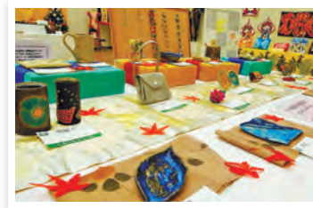
▲去年の展示の様子

時 11月1日(水)～3日(金)午前10時～午後5時(作品搬入は10月31日(火)午前10時～11時。搬出は11月3日(金)午後5時) 内 募集=木彫り、アートフラワー、陶芸、革細工、織物、ガラス細工、刺しゅうほか(絵画、書道、写真を除く)/展示パネル(幅約180cm)1枚または机(約180cm×45cm)1台に展示できる大きさまでのもの(いずれも自力で搬出入) 園 区内在住・在勤・在学の個人・団体 内 往復ハガキ(12面記入例)に作品の種類・大きさ・内容・展示方法(壁掛け、平置き)、個人・団体の別(団体の場合は団体名)、出展数と展示に必要なスペース、出展者全員の氏名も書いて、9月22日(必着)までに社会教育センター(抽選) 園 同センター ☎3317-6621 園 保険などの補償はありません