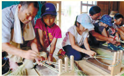
▲わらじ作りの様子

杉並の小学5・6年生が「自分で考えて生きる力を身に付ける」ことを目指し、小千谷の大自然を活かし、現地の小学生と交流しながら「8大サバイバルチャレンジ体験」やブナ林で自分より大きな作品をつくる「ものづくり体験」などを行いました。大人が答えを与えるのではなく、参加者自身が結果や危険を想像し、準備し、振り返りを行うことで、参加者の主体性を引き出しました。