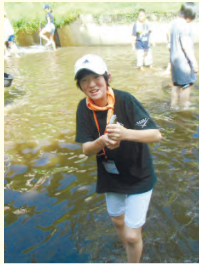
▲杉並区・東吾妻町子ども交流会マスカツカみの様子

日本には決して気付けなかったことも、ドイツという遠くの地に行き、体感し、学べたことを大変喜ばしく感じます。今回の体験で成長し、今度は自分が将来の学生たちを支えていけるようになりたいです。(高校1年男子)