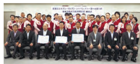
▲協定締結式（認知症サポーター養成講座受講者と）