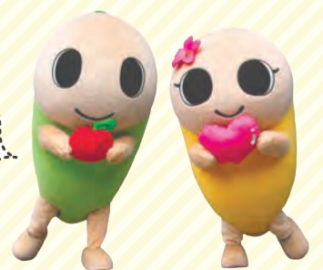
なみすけ・ナミー