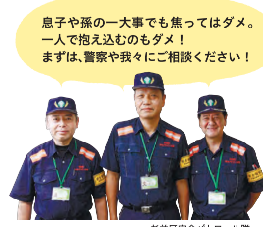
杉並区安全パトロール隊

元警視庁職員で組織し、区内全域で車両パトロールをしています。また、危機管理対策課(区役所東棟5階)や区内6カ所の安全パトロールステーションでは、防犯対策に関するアドバイス、犯罪被害に対する相談の受け付けなどを行っています。