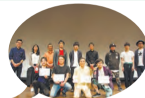
▲6月11日・12日実施の杉並ヒーロー映画祭2017 [COSMO FEST]