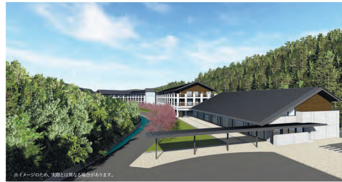
※イメージのため、実際とは異なる場合があります。