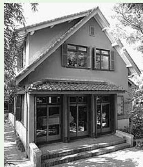
▲ 旧大田黒家住宅洋館