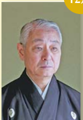
人間国宝・野村四郎氏が 名誉区民に決定