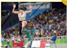
TAKAO OCHI / KANPARA PRESS