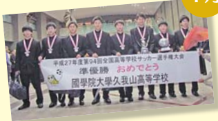
国学院大学久我山高等学校 サッカー部全国大会準優勝