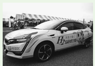
▲ H 2 なみすけ号

時 29年1月22日(日)・28日(土)午後1時30分～3時30分 場 日通自動車学校（宮前5-15-1） 対 区内在住・在勤・在学の方 定 各12名（申込順） 申 ・問 電話で、29年1月6日までに環境課環境活動推進係 他 運転はできません