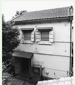
▲ 旧大田黒家住宅蔵