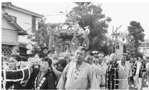
▲秋空の下、力を合わせて

こと、感謝申し上げます。神輿は立派な作りで、大切に次世代へ引き継がなければと、気持ちも引き締まる思いです。