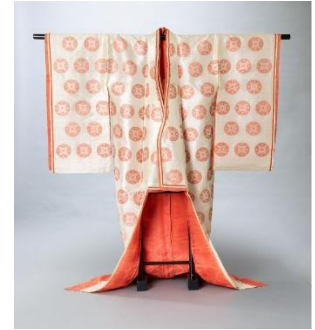
伝貞明皇后装束 (当館蔵)

貞明皇后の生涯に大きな影響を与えた杉並との関わりに焦点を当てるとともに、大正天皇病氣平癒のため祈祷が行われた大乘寺に下賜され、当館に寄贈された品々など、関連資料を展示します。