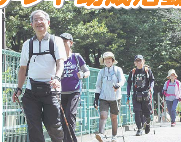
▲ポールウォーキングで、高齢者の健康増進を目指します (NPO法人みんなの元気学校)