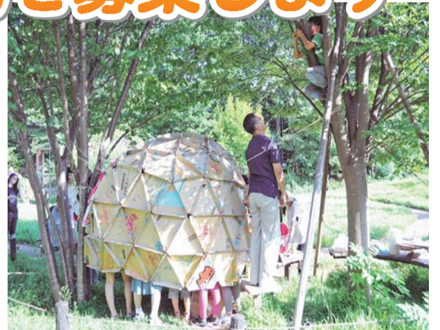
▲小さな手作りの映画館で地域の交流活動を行います (ちいさなひとのえいががっこう)

ボランティアやスポーツなど、多くの高齢者の皆さんが元気に、楽しく参加している「杉並区长寿応援ポイント事業」では、参加者の皆さんがためたポイントの一部を「地域貢献活動に役立てられるように」寄付していただいています。このポイント寄付を原資とした「長寿応援ファンド」を活用して、子ども・若者世代の支援、高齢者の日常生活や健康づくりなど広く地域に貢献する活動に対し、資金の一部を助成しています。