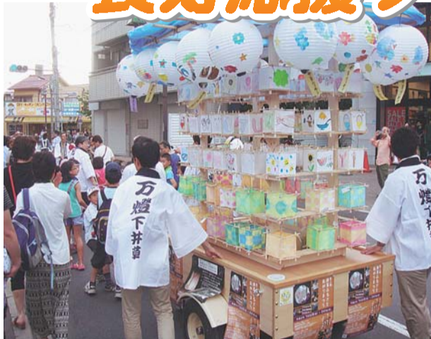
▲「灯り」がテーマのイベントで、世代間交流と文化継承を図ります