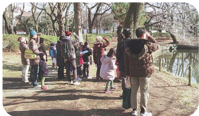
▲昨年度の善福寺川水鳥一斉調査の様子

本調査は小学生と保護者の皆さんに参加していただき、毎年1月中旬に実施し、調査結果はシンポジウム会場でお知らせしています。