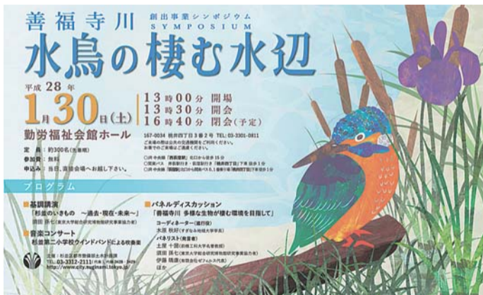
ポスターは女子美術大学制作