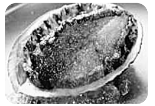
▲梅の宴宿泊プランはあわびの陶板焼き付き

申・問電話で、湯の里「杉菜」(神奈川県足柄下郡湯河原町宮上279 ☎0465-62-4805)