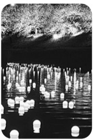
天の川プロジェクト®

申・問電話で、弓ヶ浜クラブ(静岡県賀茂郡南伊豆町湊781 ☎0120-412-224)