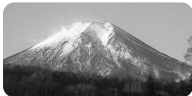
▲富士学園付近から見た富士山

時・内・費 下表のとおり 場集合・解散=JR荻窪駅・阿佐ヶ谷駅、京王線明大前駅 申・問電話で、あんしん宿予約センター ☎0120-844-891(午前9時～午後5時) 他 最少催行人数=各25名