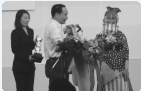
昨年の表彰式の様子