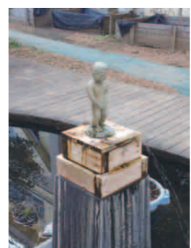
最近あまり見かけなくなった噴水像(通称・小便小僧)。20cm程度の小ぶりのものですが、校舎北側の池で存在感を放っています。

平成26年度に新校舎が完成したばかりの小学校。周辺は久我山の閑静な住宅街で、校舎からはまちなみ通りがちらほら見えます。写真は、校舎3階のランチルームから見た風景。ランチルームは、低学年と高学年の交流の場として使われている部屋。屋上の芝生広場越しに高井戸の杉並清掃工場の煙突が見えます。