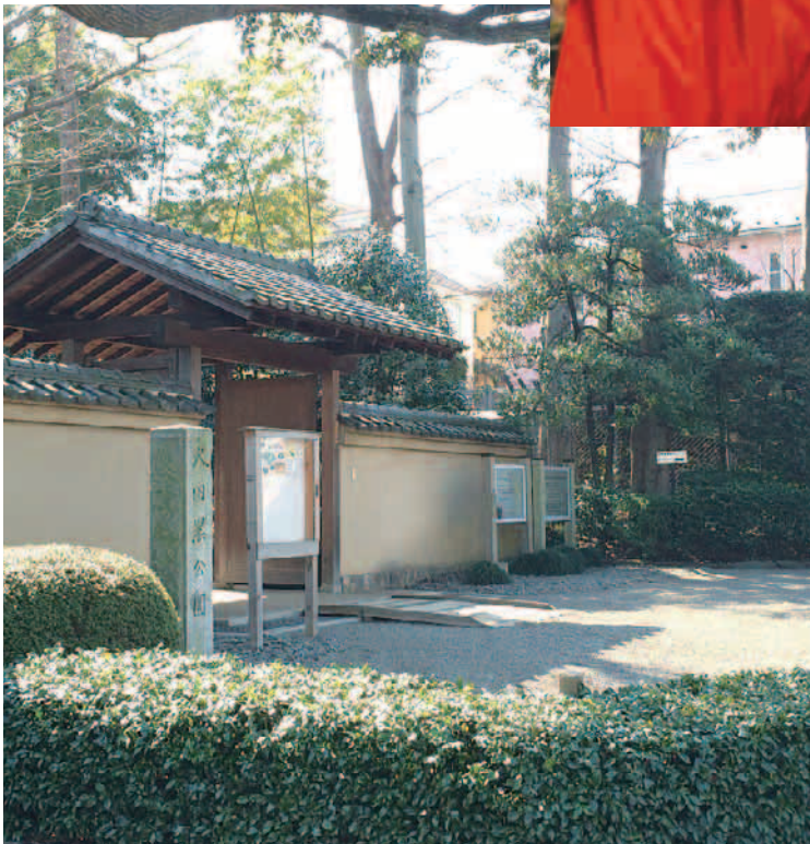
◀大田黒公園 (荻窪 3-33-12)