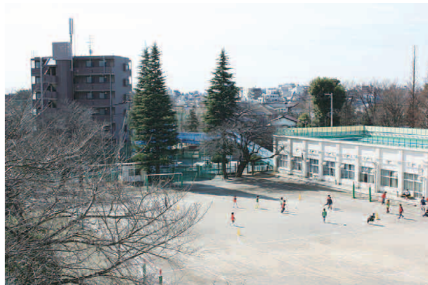
屋上の芝生広場では、東には東京スカイツリー、西には富士山と、シンボリックな風景を見ることができます。

新青梅街道と旧早稲田通りの交差点のすぐそばにある小学校で、区内の学校としては最北に位置しています。周辺は低層の住宅街ですが、街道沿いには背の高いマンションなどもちらほら見えます。校舎3階の窓から見渡すと、大きなヒラヤスキ越しに、街道を挟んで南側に広がる低層住宅、さらに奥には西武新宿線沿いのマンション群が見えます。