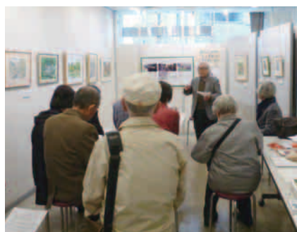
前野氏による講演会

作者による製作の苦労話と作品解説が行われ、来場した方は皆熱心に耳を傾けていました。