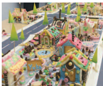
お菓子の家で作られた街

東京建築士会杉並支部主催の親子で参加する教室で、設計図作り～確認申請～家づくり～街づくり、という工程をこなす本格的なものでした。子どもたちは、いろいろな種類の市販のお菓子や色とりどりのアイシングを使って一生懸命お菓子の家を作り、自分たちの家の自慢ポイントを誇らしげに語っていました。