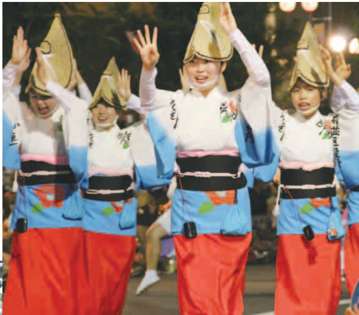
▲東京高円寺阿波おどり