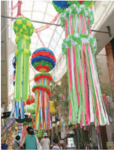
▲阿佐谷七夕まつり