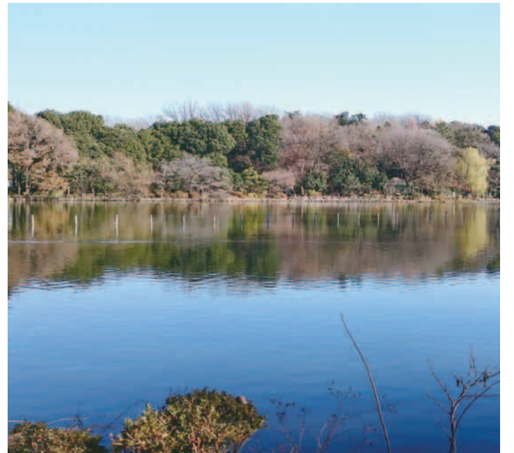
▲善福寺公園 (善福寺 3-9-10)