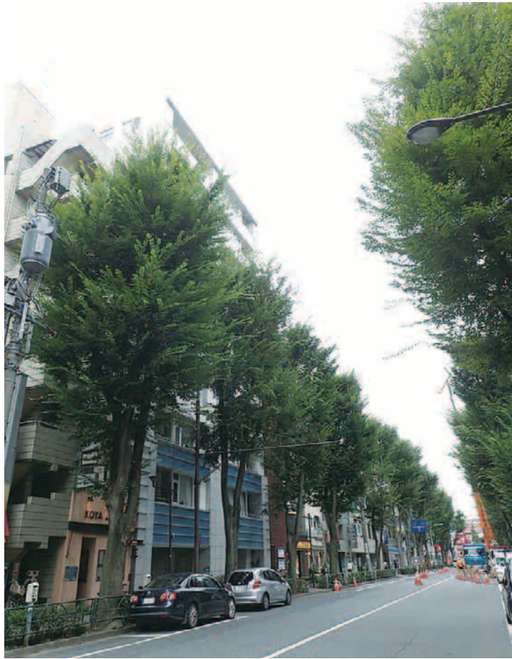
▲中杉通りケヤキ並木 (阿佐谷南 1-16 付近)