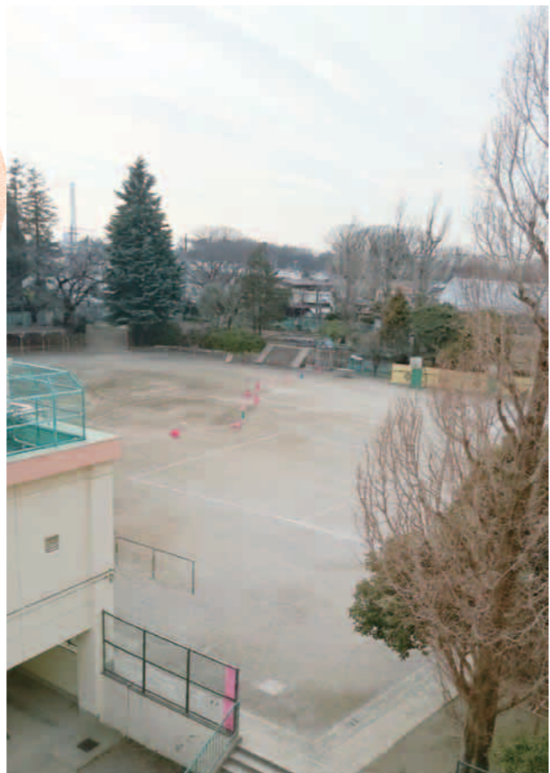
撮影の日はちょうど積雪予報の前日だったため、先生たちが総出で融雪剤を撒いていました。

善福寺川緑地に面した小学校で、周辺には尾崎熊野神社など、まったりとみることが出来ます。今はすぐ近くの阿佐谷住宅が建て替え中で、大型のクレーンがよく見えます。写真は、校舎3階からの風景。校舎西側の道路から東側の善福寺川緑地に向かって傾斜のある立地のため、大きな樹木と校舎に囲まれた校庭は、すり鉢のように見えます。