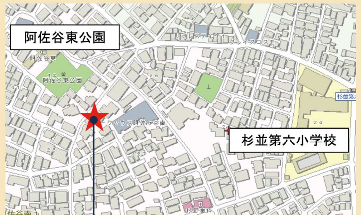
公園予定地 / 阿佐谷南 1-27 (373 m 2 )