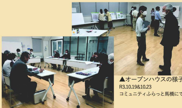
▲オープンハウスの様子 R3.10.19&10.23 コミュニティふらっと馬橋にて

昨年中に開催した説明会（オープンハウス形式）や「阿佐谷南・高円寺南地区まちづくりを進める会」でいただいた皆様からのご意見も踏まえ、この度、整備案がまとまりましたのでお知らせします。