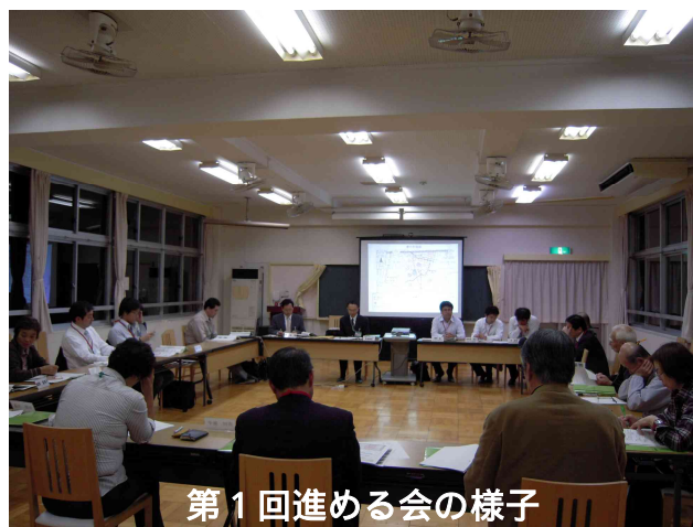
第1回進める会の様子