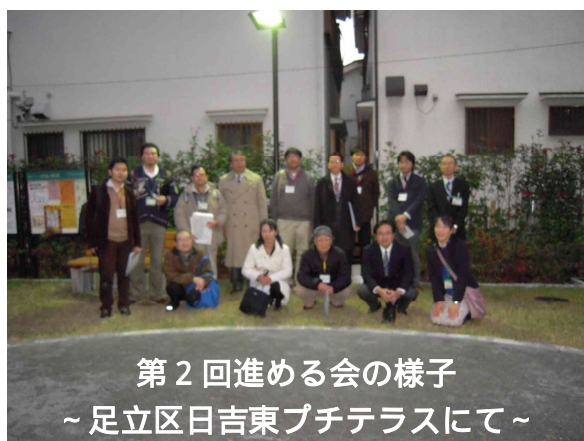
第2回進める会の様子 ～足立区日吉東プチテラスにて～