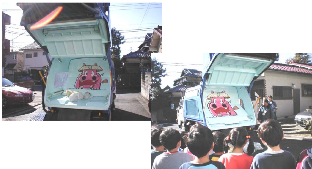
(清掃車「ごみぱっくん号」による環境学習)