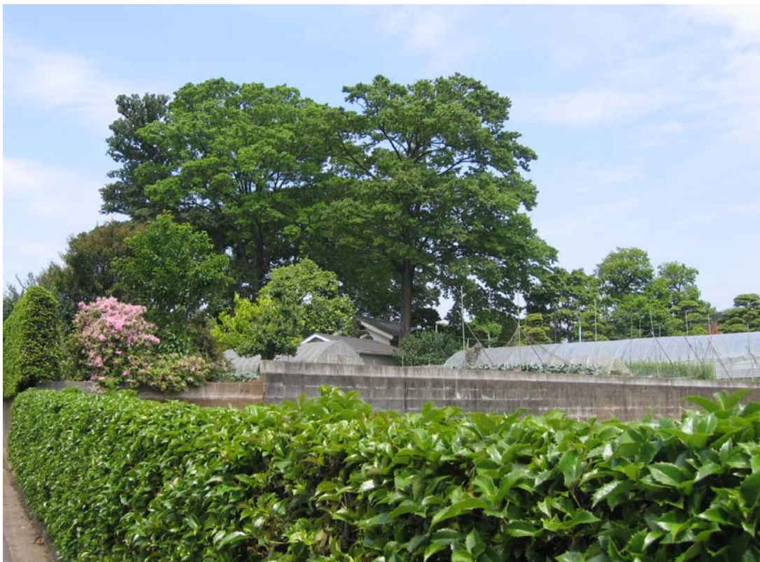
(区内にある屋敷林の風景)