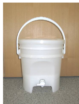
▲コンポスト容器の一例