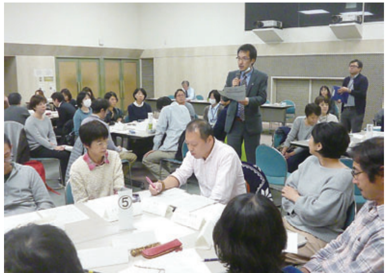
高円寺圏域の第2回在宅医療地域ケア会議

2回目のケア会議では、薬剤師から「遠慮をしないで薬剤師にもっと情報を入れてください」「薬剤師も(チーム)に入れてください」という呼びかけがあり、「退院カンファレンスには薬剤師さんにも加わってもらって、提案してもらおうと助かる」などの意見が出ていました。