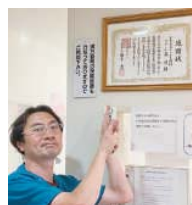
↑コロナの診療について区長から表彰されました。

がいを感じています。父親が高円寺南で開業した「こじま内科」を2016年4月に継ぎました。大学病院では「診断がついた人」を診ますが、クリニックではゼロからです。幼児から高齢者まで患者さんの主訴を聞いて、その背景