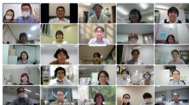
〈会議終了時の記念撮影〉

【方南・和泉圏域】 対面とオンラインを1回ずつの計2回(10月と1~3月)開催を目指す。テーマは多職種連携の困りごと。