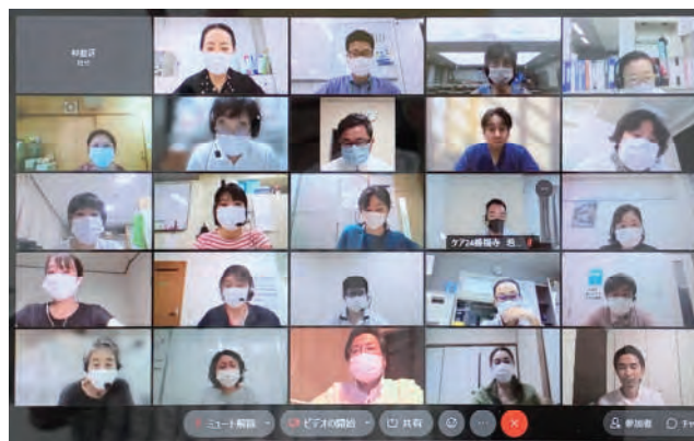
オンラインで話し合う全体会議

また、「コロナ陽性患者・濃厚接触者・自宅療養者のケア、介護者に入院治療が必要となった場合の、要介護者本人のケアをどうしていくかを話し合いたい」（阿佐谷）、「昨年度は対面形式で開催したが、参加者には好評だった。今年度は看取りをテーマにオンラインを含め検討する予定」（高円寺）、「コロナ禍で情報を得る機会が減っている。同じ職種同士で集まり、情報共有する提案もあった。地域ケア会議は年内に開催したい」（高井戸）、「各専門職が抱える悩み、必要としていることを話し合い、多職種の連携につながれば」（方南・和泉）などの意見も紹介されました。