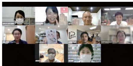
模擬オンライン退院時カンファレンス

1回目の多職種連携オンライン会議は、「バイタルリンク活用について」がテーマ。開催側がケアマネジャーや看護師らに個別に参加を呼びかけ、60人が参加しました。シス