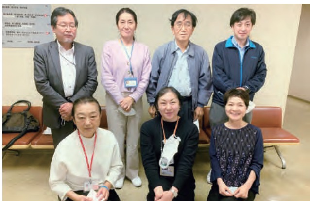
7圏域の主任ケアマネジャーの皆さん