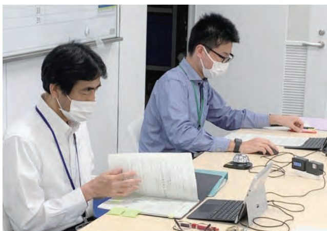
会議資料を説明する事務局

事務局から示された令和3年度の地域ケア会議の実施案では、(1)各圏域とも1回以上の開催とする、(2)1グループ10人を超える対面によるグループワークは好ましくない、(3)オンライン形式の開催も可能、(4)開催テーマは従来の退院支援、日常の療養支援、急変時の対応、看取りの4つの場面に加え、「コロナ禍における」これら4つの場面から選定する一などが示されました。