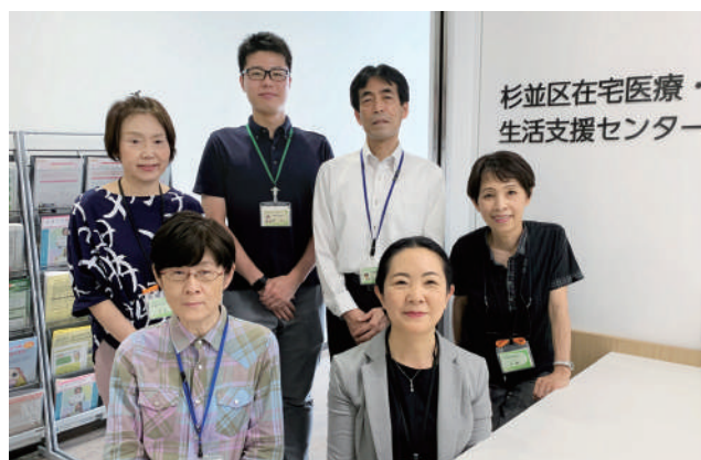
松田所長と本紙を担当する在宅医療・介護連携推進係職員 ※写真はすべて、撮影時のみマスクを外しています。

また、在宅医療相談調整窓口（3ページ参照）を設置し、退院時やその後の在宅療養生活に関する相談、適切な医療や介護サービスにつなげる支援など、さまざまな相談を広範囲にお受けしています。在宅療養者が一時的な入院加療が必要となった場合には、後方支援病床への入院調整