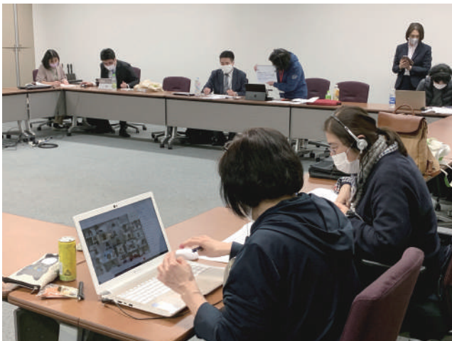
オンライン会議進行役の皆さん

その一方で、「オンライン会議中、音声途切れる場面があった」「より円滑なオンライン開催には運営メンバーのスキルの向上やスキルがある人の支援が必要」「オンラインツールには機能の制約もあり、今後の開催ではアクセスの簡便化、運営の効率化、効果的な情報共有等の検討が必要」などの課題も抽出されました。オンラインによる開催や情報共有の利点・課題が分かり、次につながる試みとなりました。