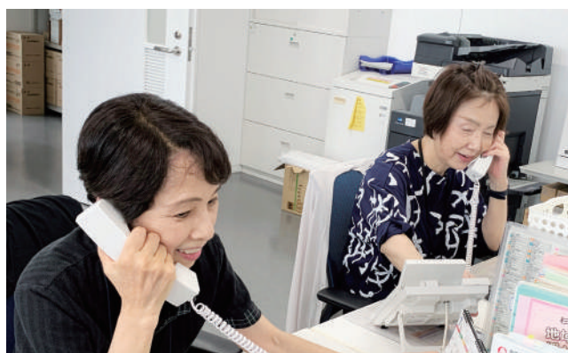
電話相談を受ける相談員

歯科や眼科、耳鼻科などが関係する相談も伺っています。必要に応じて各専門の医療機関等へつなぎます。また、関係機関の“はざま”にある問題に対応することも、私たちの大事な仕事と考えています。