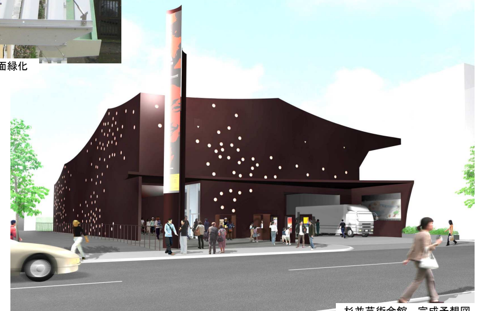
杉並芸術会館 完成予想図