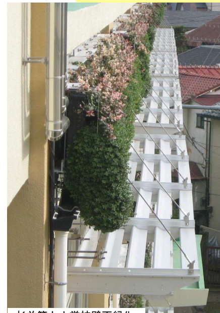
杉並第七小学校壁面緑化