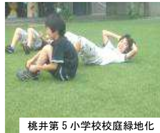
桃井第5小学校校庭緑地化 杉並区役所