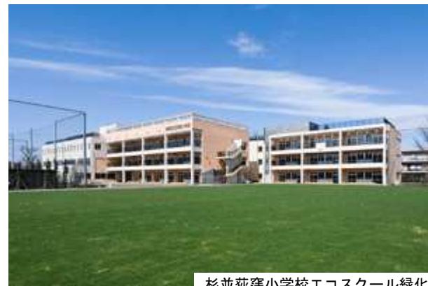
杉並荻窪小学校エコスクール緑化