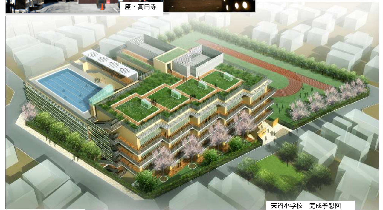
天沼小学校 完成予想図