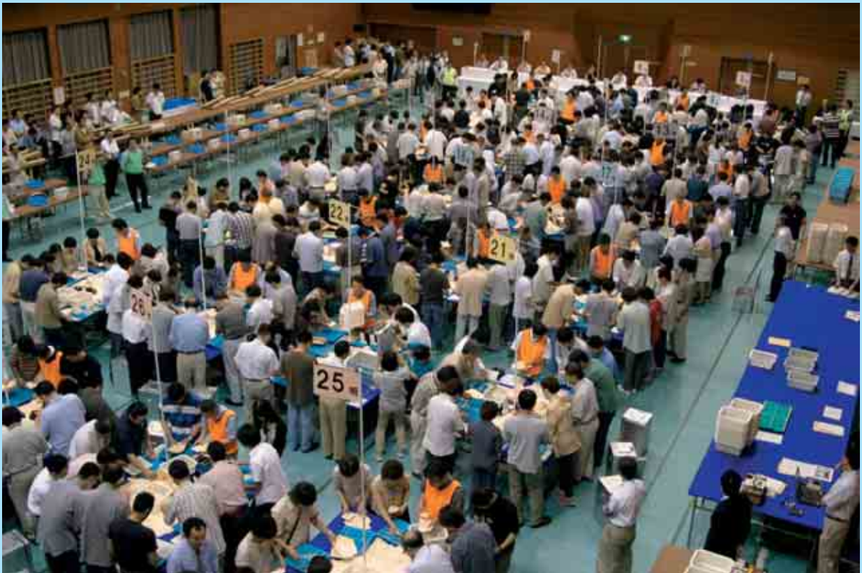
東京都議会議員選挙開票作業風景 (平成17年7月3日執行・杉並区荻窪体育館)

投票日当日に用事があっても投票できます! 期日前投票をご利用ください (詳しくは4ページをご覧ください)