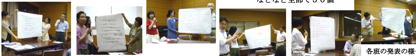
各班の発表の様子