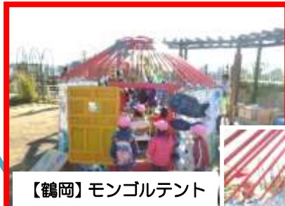
【鶴岡】モンゴルテント