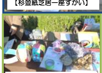
【しもつけ大人塾】手芸品