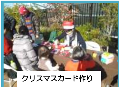
クリスマスカード作り