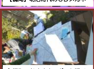
永福町のおすすめスポット調べ