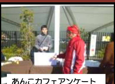
あんこカフェアンケート