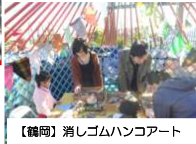
【鶴岡】消しゴムハンコアート