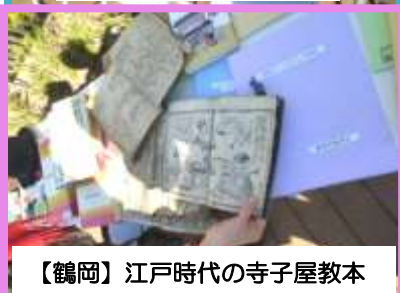
【鶴岡】江戸時代の寺子屋教本