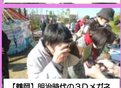
【鶴岡】明治時代の3Dメガネ