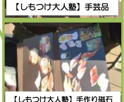
【しもつけ大人塾】手作り磁石