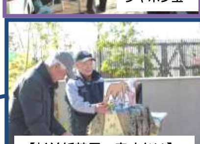
【杉並紙芝居一座すかい】