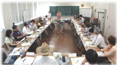
↑部屋いっぱいの受講生

「もの」を通した自己紹介によって、「あの人が持ってきた〇〇について、もっと話したいな」という思いが生まれたようだ。全12回の講座、話す機会はまだまだこれから。どうぞ、よろしくお願いします！（記事：坂本）