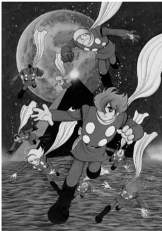
Cyborg 009 © Ishimori Shotaro Production Inc.

This exhibition will include numerous cartoons, such as "Tensai Bakabon" (Genius Bakabon), as well as rare and amusing photos.