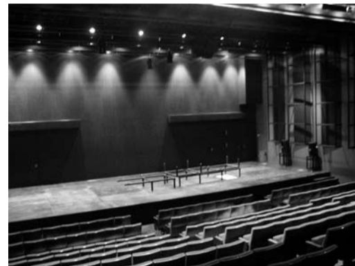
ZA-KOENJI 2 (Civic Hall)