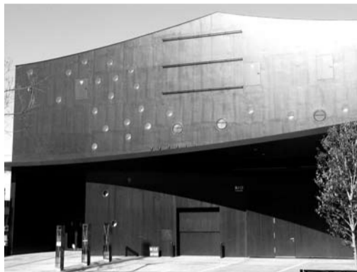
The outside of ZA-KOENJI Public Theatre

Inquiries: ZA-KOENJI Public Theatre, Tel: 03-3223-7500