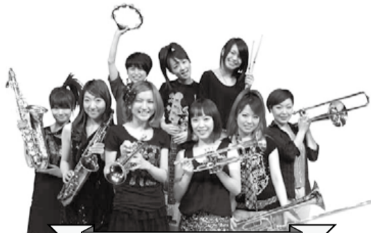
東京ブラススタイル

詳細は、 阿佐谷ジャズストリート ホームページ http://www.asagayajazzst.com/ をご覧ください