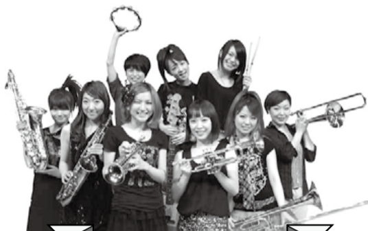
Tokyo Brass Style

For further details, please visit Asagaya Jazz Street website at http://www.asagayajazzst.com/