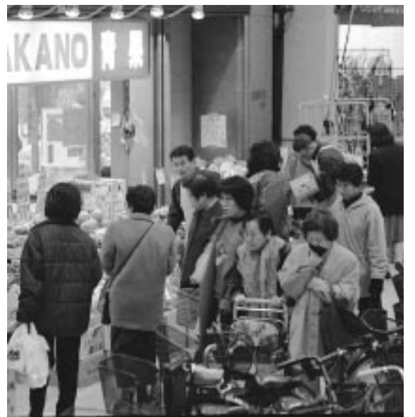
年末年始の準備と併せて非常用品も忘れずに

コンピュータシステムの誤作動などにより、ライフライン(電気、上下水道、ガス等の生活基盤)の停止や金融、交通、医療などの分野で区民の皆さんの日常生活に支障が生じる可能性が指摘されており、「コンピュータ西暦2000年問題(Y2K)」と言われていています。 政府では日常生活に重大な問題は生じないとの見解を示していますが、区では、万一の場合最小限の影響にとどめるように対策を立てています。 関係機関などからは、事前対応はすべて完了しているという報告を受けています。 防災関係機関の対応状況 110番や119番通報システム、交通信号機システム自体については点検が完了しているとの報告を受けています。