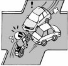
若者ライダーの死亡事故多発

今年は、都内・区内ともに交通事故が急増しています。特に年末は、交通事故が多発する時期なので、より一層注意してください。