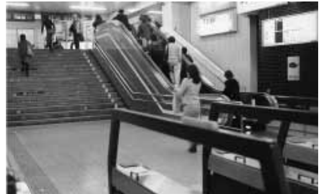
JR阿佐ヶ谷駅に設置された車いす対応エスカレーター