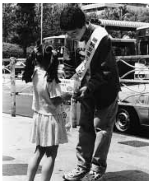
J R 中野駅前での募金活動