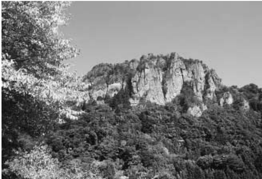
秋空にそびえる紅葉の岩櫃山