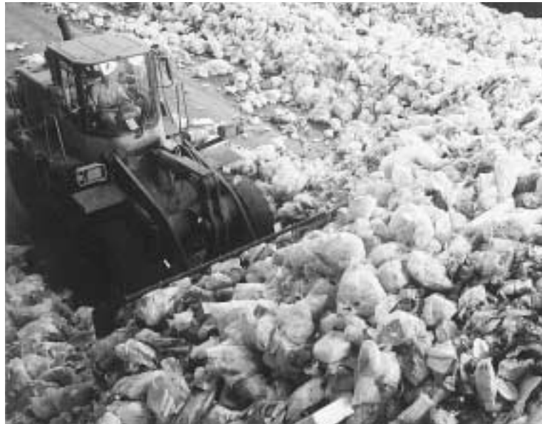
中央防波堤埋立処分場（江東区青海2丁目地先）

その結果、環境に対する意識の高揚やごみの減量、リサイクルの推進を図ることを目的として、「レジ袋税」を創設することが望ましいとの結論に達しました。